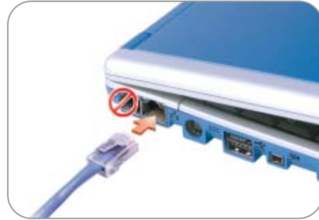
3 Network Réseau Red